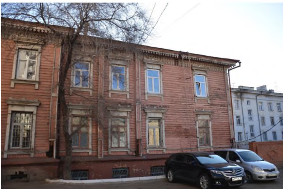
Фото 3 Фрагмент северо-западного фасада