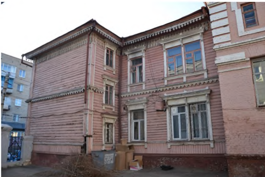
Фото 2 Вид с северо-востока , фрагмент фасада.