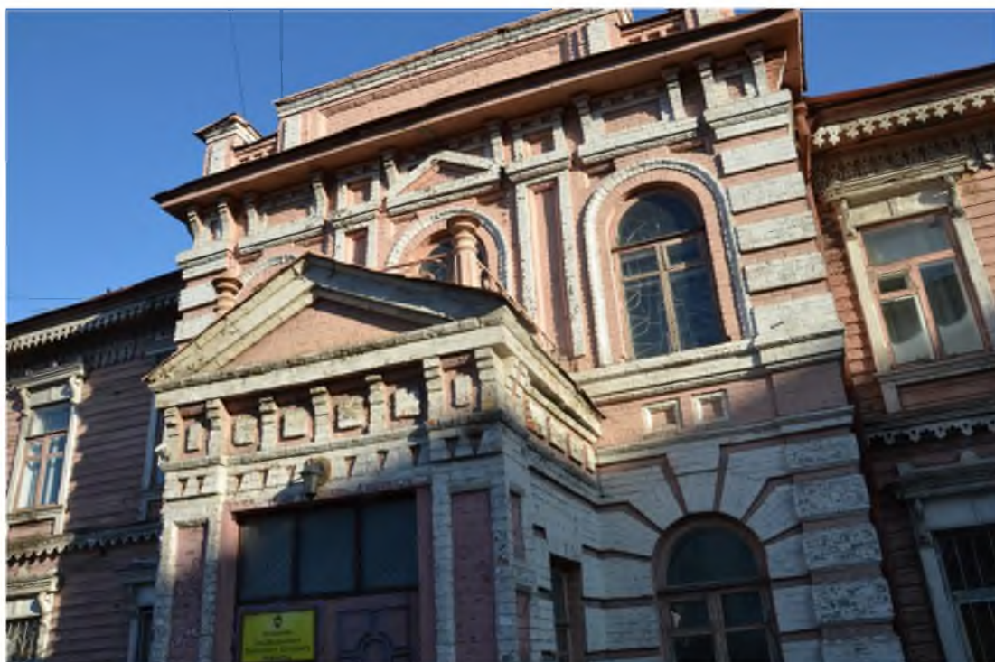
Фото 4 Фрагмент юго-западного фасада