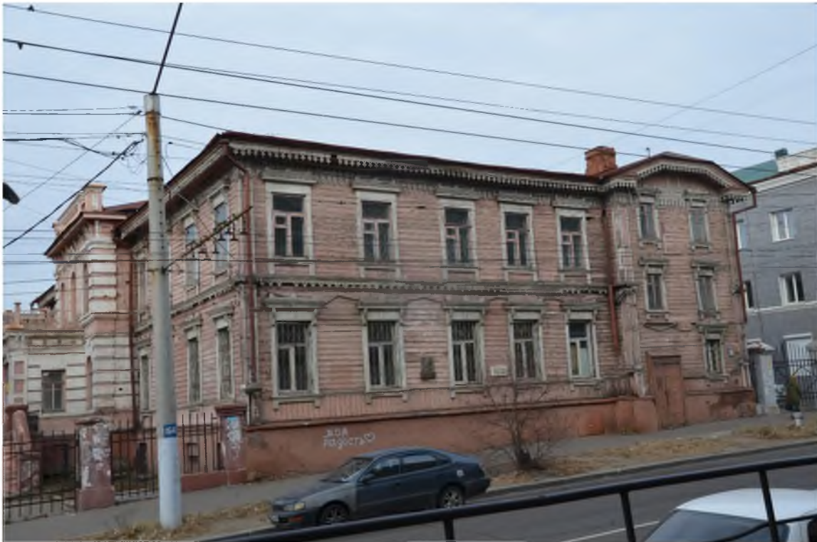
Фото 1. Главный юго-восточный фасад.

Фотографическое изображение объекта (на момент утверждения охранного обязательства): «Дом Гражданского губернатора» Забайкальский край, г. Чита, ул. Ленинградская, 3